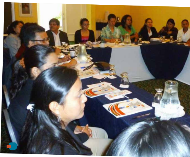
Participantes del taller formativo en Ciudad de Guatemala.