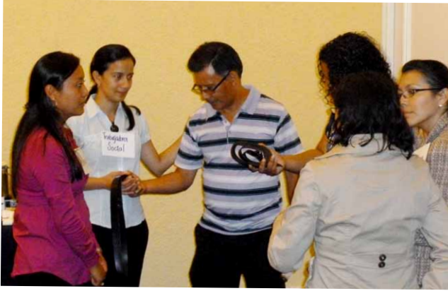
Los participantes aplican las técnicas del Teatro Foro.

Debemos tener claro hasta donde queremos llegar con este niño/a, debemos saber para dónde vamos.