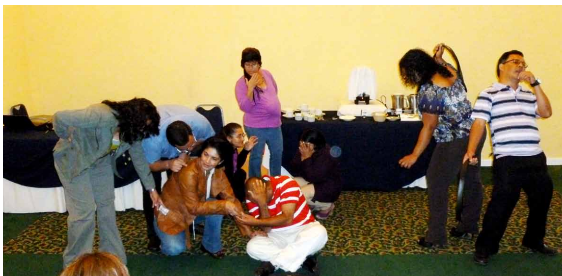
Los participantes aplican las técnicas del Teatro Foro.

La Facilitadora expuso que lo más importante es visualizar qué queremos lograr en la reparación del daño o de los daños, ¿cuándo podemos decir que el daño está reparado?, ¿qué quiero lograr?, ¿hasta dónde quiero llegar?. Hay proyectos que tal vez solo buscan aminorar el daño. A veces hay otros proyectos en donde se busca que se protejan, que negocien con el cliente el uso del condón, el pago, etc. Esto tiene que ver, también, con la mirada institucional donde trabajamos, qué es lo que se busca. Nosotros, como ONG Raíces, buscamos que la víctima viva un proceso tal, que nunca más pueda ser víctima de la ESC. Queremos que el niño entre en un proceso cuyo objetivo sea sacarlo de la ESC y nunca más vuelva a caer, reconstruir su vida, protegiéndose de aquello que le ha hecho daño. Sabemos que estos son dolores para toda la vida y con eso se vive, pero si hay reparación, estará mejor.