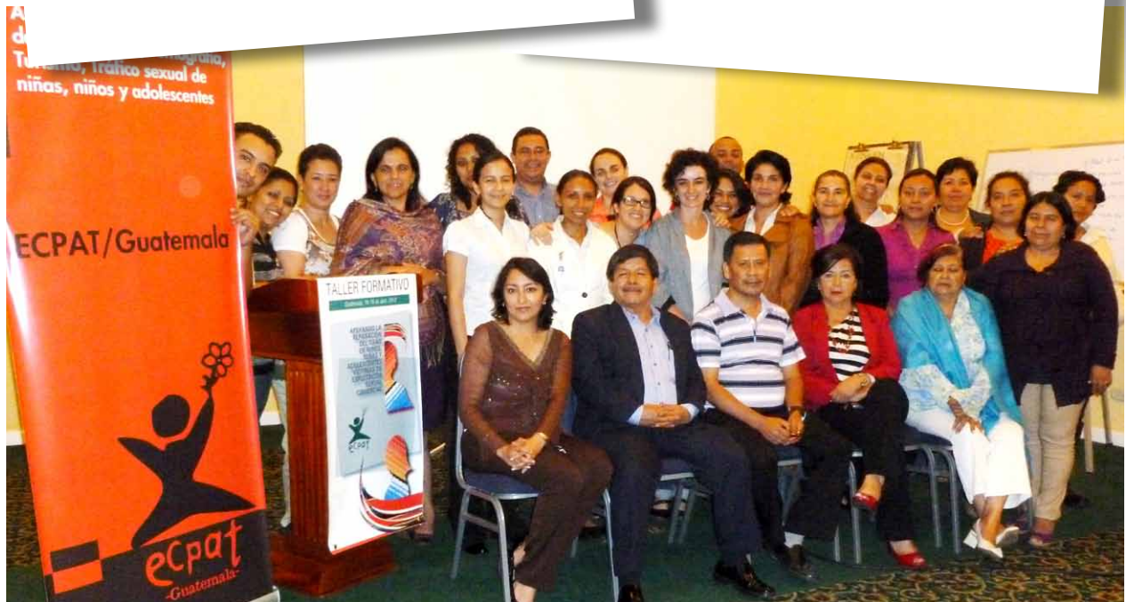
Entrega de diplomas al final del taller formativo y la fotografía del grupo.